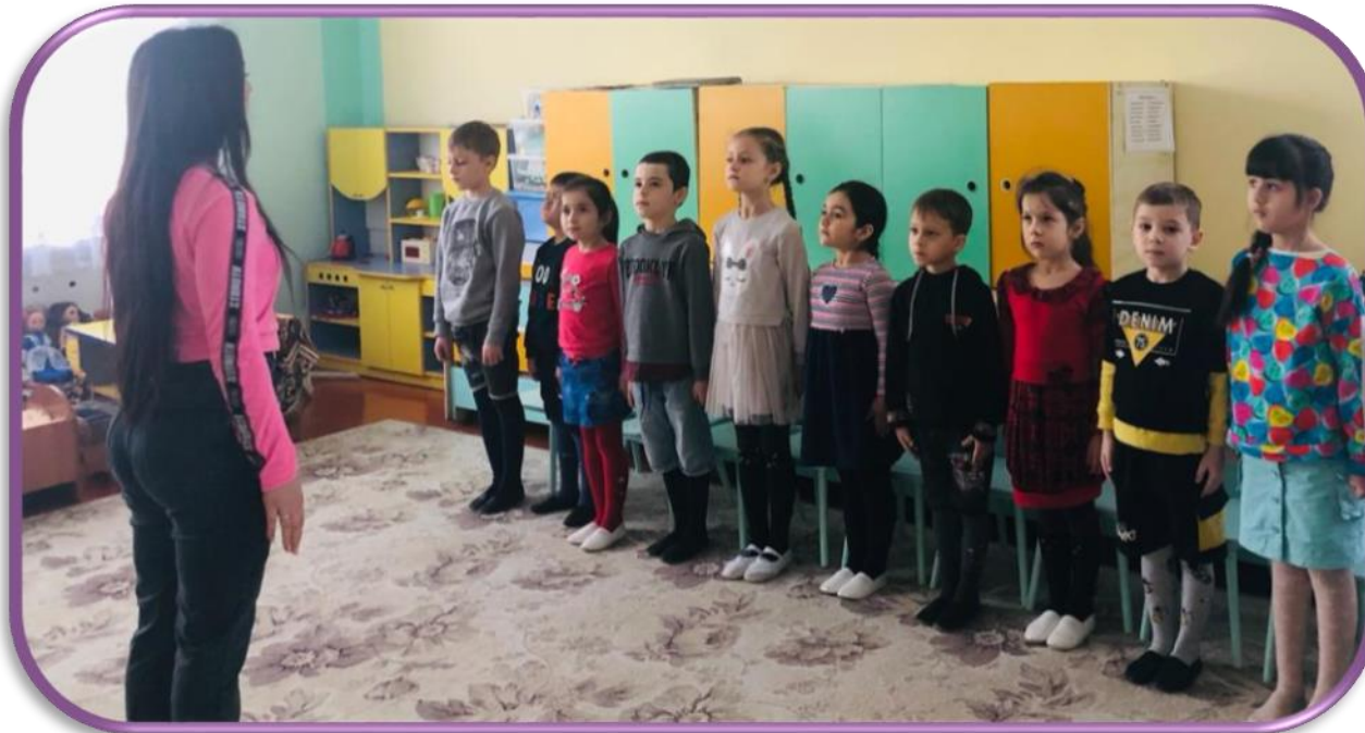
Прослушивание гимна России

У детей был выражен положительный эмоциональный настрой во время проведения мероприятий. Проведена работа по сплочению отношений воспитанников, педагогов и родителей.