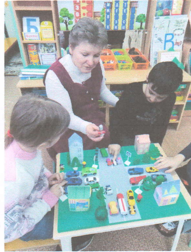
- математический центр и центр развития речи