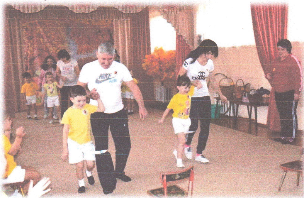
Заведующая МБДОУ детский сад № 30 «Родничок»